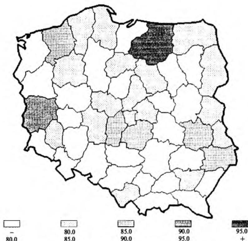
Ryc. 2. Szczepienia przeciw odrze dzieci urodzonych w 1993 r. Odsetek zaszczepionych według województw. Stan w dn. 31.XII.1994 r.